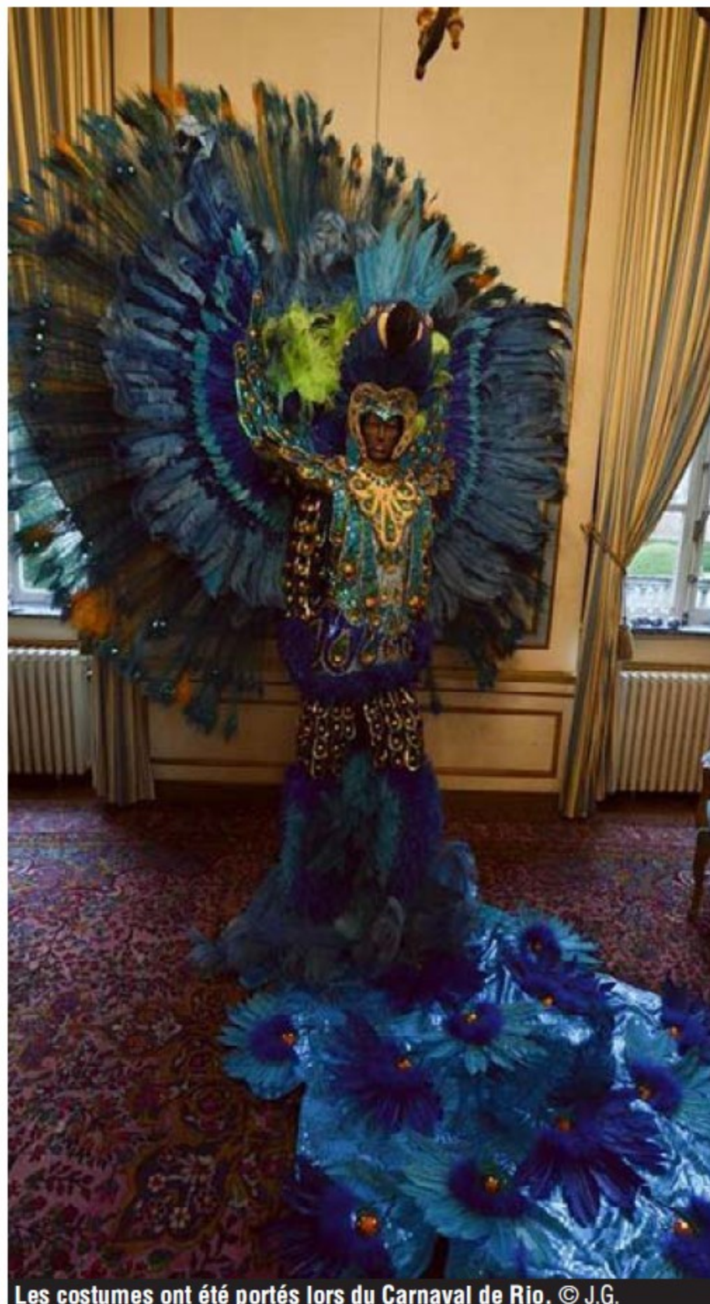
Les costumes ont été portés lors du Carnaval de Rio.

à noter L'exposition se tiendra jusqu'au 5 janvier 2020. Elle est accessible de 11h à 18h, y compris lors des jours de fête. Alain Taillard sera présent ce jeudi de 15h30 à 18h pour réaliser une visite guidée. L'entrée est de 11 euros par personne, 5,5 euros pour les enfants de 6 à 12 ans et gratuite pour les moins de 6 ans. Réservations au 085/41.13.69.