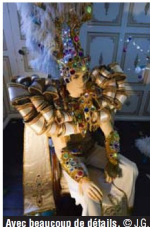
Avec beaucoup de détails. © J.G.