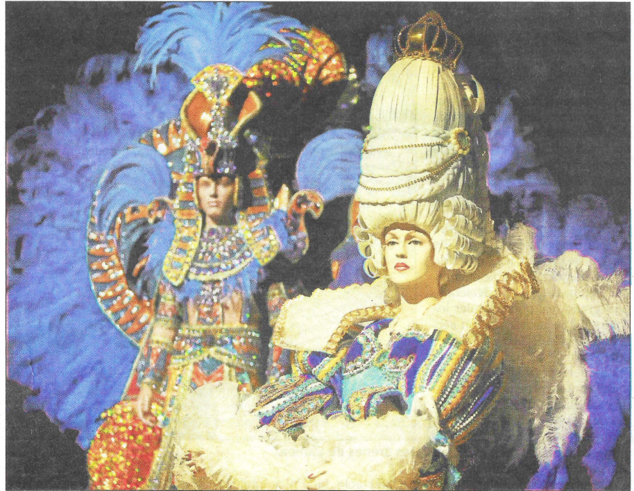
Jusqu'au 5 mars, le musée Masséna vibre au rythme effréné du carnaval de Rio. Un défilé de costumes et de couleurs qui met de la joie et de la féerie au cœur.

Derrière son décor de rêve, le carnaval porte en lui toutes les hiérarchies, rivalités, luttes, ruptures, aspirations, espoirs. « À l'origine, glisse Jean-Pierre Barbero, la samba est un chant de révolte des esclaves noirs. C'est le carnaval du peuple. Comme ici. On déverse de l'eau au Brésil. À Nice, à l'origine, c'est la farine et la suie. » Quant aux fleurs exportées de Nice vers Rio, elles furent au fil du temps remplacées par des plumes. De paon, d'autruche, de perdrix... et maintenant, de plus en plus synthétiques. « En 1977, les deux carnivals sont jumelés. Il était donc cohérent d'aborder Rio dans une villa dédiée à un musée d'art et d'histoire de Nice... »