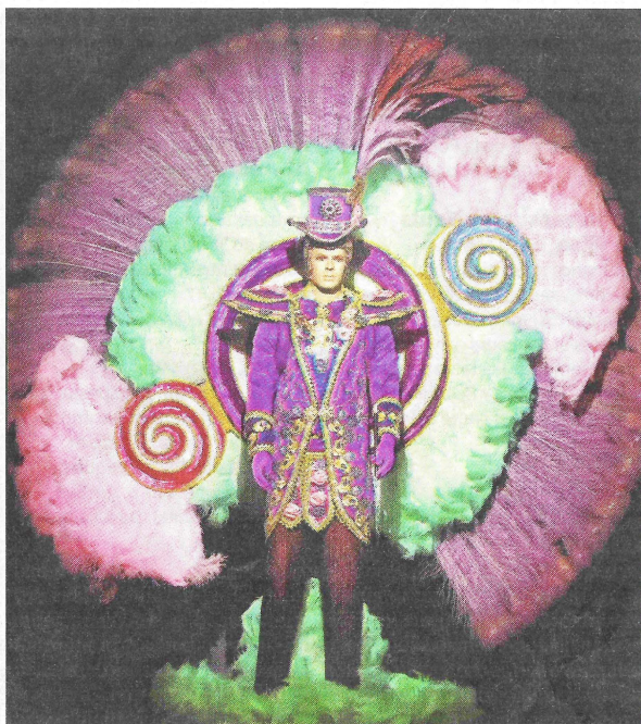
Un magicien aux effets très spéciaux.

Exposition jusqu'au 5 mars au musée Masséna (65, rue de France). Du mercredi au lundi, de 10 à 18 heures. 8 euros pour les porteurs de billet de carnaval au lieu de 10 euros. 04.93.91.19.10. musee.massena@ville-nice.fr